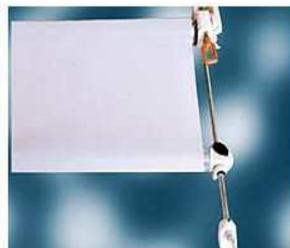
Croquis et photos non contractuelles.

Toile à store DICKSON 100% acrylique teint masse Sunacryl, traitement Cleangard spécial Store antissalissures et déperlant, poids 300 gr/m 2 +/- 7%, garantie 5 ans. 195 coloris au choix ! Choisir parmi la collection Orchestra, collection Rhythm & Harmony en + value.